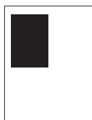
1/4 pagina 1/4 staand - 97 x 127 mm