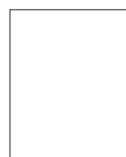
1/1 pagina 1/1 pagina 230 x 297 mm aflopend 236 x 303 mm