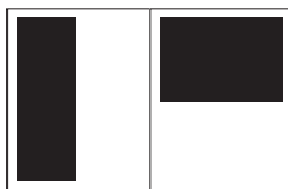
1/2 pagina 1/2 staand - 97 x 260 mm